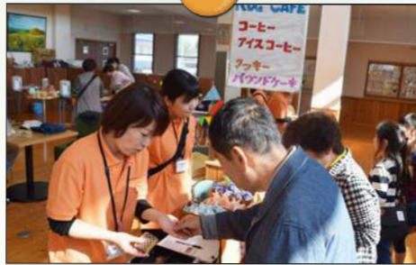
Rog Cafe でコーヒープレイク