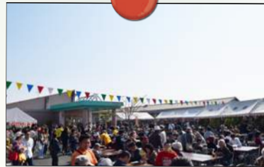
今年も晴天の中開催する事が出来ました。