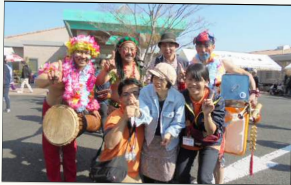
やうちブラザーズ様とハイポーズ☆