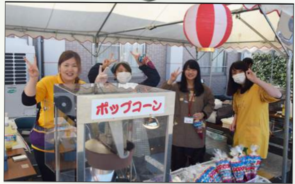
今年のキャラメル味ポップコーンはいかがだったでしょうか？