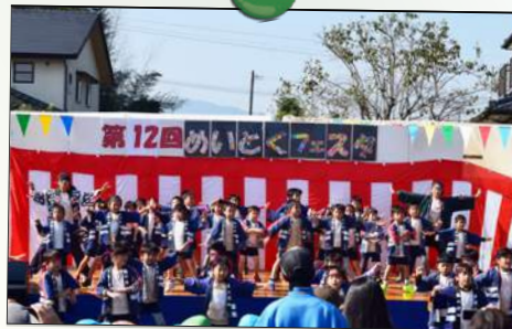
元気いっぱい、北部幼稚園様