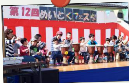
笑顔輝く、おひさまクラブ様