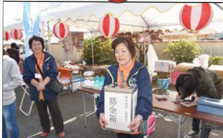
沢山の募金を頂きました!!