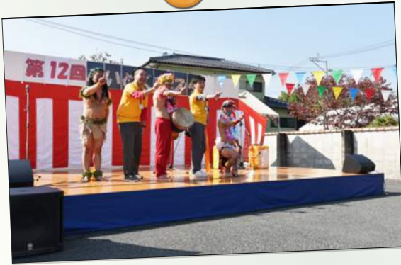
やうちブラザーズ様と職員のコラボステージ