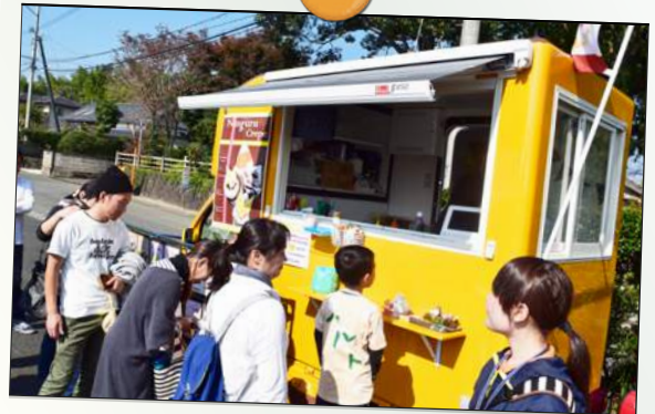
人來瑠様のおいしいクレープ★