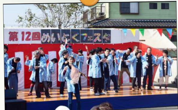
ハリハリで皆さん楽しく踊って頂きました☆