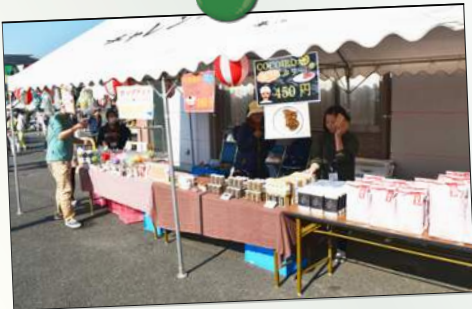
B型で作ったお米・カレー美味しかった!!

めいとくフェスタにて皆様から頂いた募金、総額32,253円は、熊本市の「平成28年熊本地震への義援金」へ送金させていただきました。ご支援ご協力いただきました皆様に心よりお礼申し上げます。