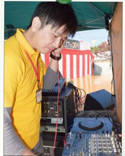
みんなノッてるかーい!!