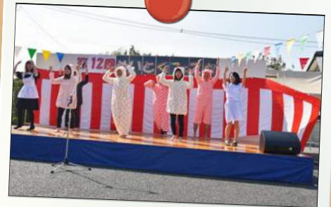
毎年恒例!! 新人出し物!!

第12回めいとくフェスタは天候に恵まれ、ご利用者の皆様、ご家族の皆様、地域の皆様、また、明徳会に縁の深い皆様が笑顔で過ごしていただき、大盛況のうちに終了することができました。今年4月に未曾有の大地震があり、それからやっと半年が過ぎました。この間に、全国の各方面・各関係機関から多くのお見舞いや励ましをいただきました。お蔭様で、例年通りめいとくフェスタを開催できましたことは何よりの喜びでした。ステージイベントの「北部幼稚園」様、「おひさまクラブ」様、「やうちブラザーズ」様、また、出店していただきました「藤屋」様、「ママス・パパス」様、「人來瑠」様、「キッズ・スタジオ・ムサシⅡ」様、参加いただいた皆様にはフェスタを盛り上げていただき、本当にありがとうございました。