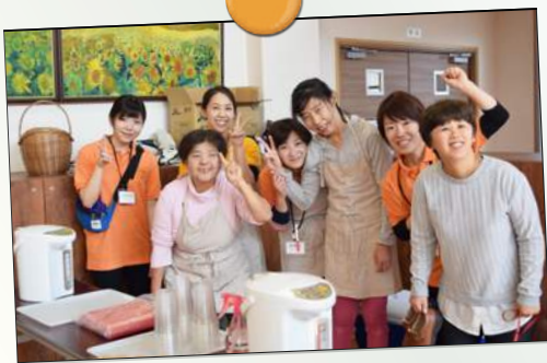
ご来店ありがとうございました By Rog Cafe