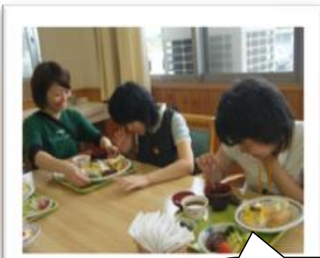
七夕バイキング 工夫されたメニュー

ご利用者様が残さず食べて下さる事が、嬉しい限りです。 やはり、暑い夏ですので食欲が落ちることも・・・。さっぱりしたメニューやスパイシーなメニュー(弱めです)。スタミナがつくようなメニューを意識して献立に取り入れてます。